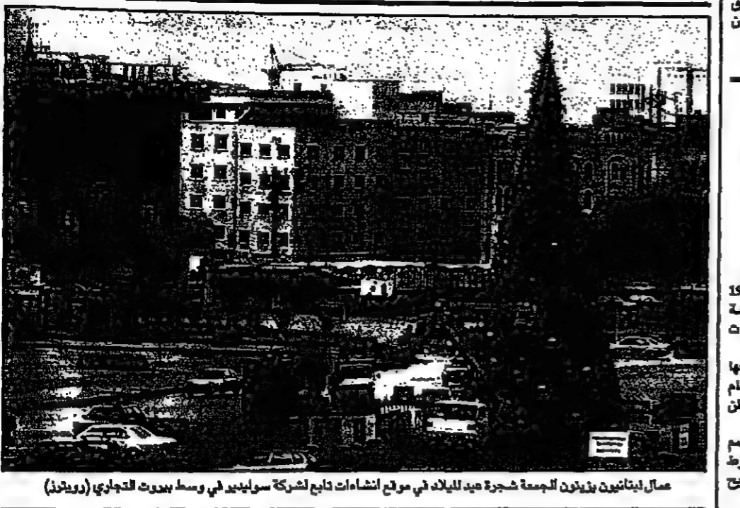
عمال ايثانول يملكون الجمعة شجرة عيد الميلاد في مرفق انشادات تابع لشركة سايبير في وسط بيروت التجارية